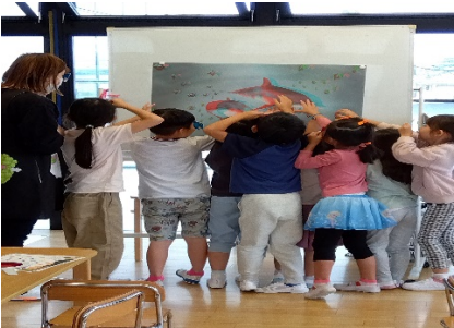
「わ〜あ、イルカが近くで泳いでいる・・・手で触れそうだね」

今日はどんなことをするのか説明を集中して聞いていました。「カタツムリ・ピーマン」の絵を赤色の丸いフレームから見ると、「え！カタツムリが〇〇になってしまったけど、どうして？なんでかな？・・・」不思議ですね〜。