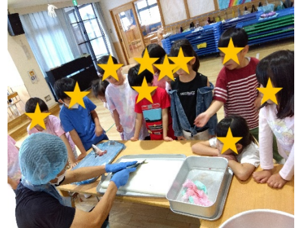
「魚ってそんなふうきれいにさばくのだね」